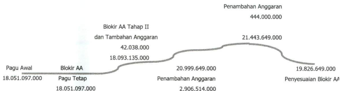
Gambar 2 Perubahan Anggaran Tahun 2022