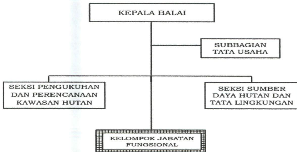
Gambar 1. Struktur Organisasi Balai Pemantapan Kawasan Hutan Dan Tata Lingkungan Wilayah XXI